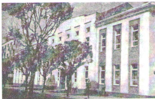
... и сад

Садашња зграда гимназије подигнута је 1927. године и тада је добијен школски простор за гимназијско образовање. За време Другог светског рата зграда Гимназије претворена је у болницу, а ученици су имали наставу у Соколском дому, у подруму општине (садашња зграда пензијског осигурања), у Добричеву, у Ади поред Велике Мораве.