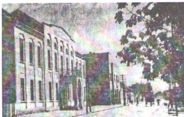
Зграда Гимназије некад...